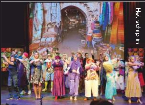
Het schip in