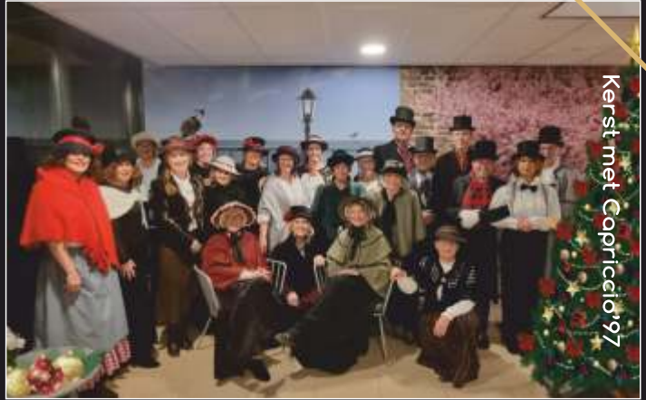
Kerst met Capriccio'97

Ook worden er kleinere optredens gegeven met thema-muziek uit de '70's, '80's en '90's van de vorige eeuw. Deze koornummers, solo's en duetten werden tevens gezongen in de afgelopen producties van Muziektheater Capriccio'97.