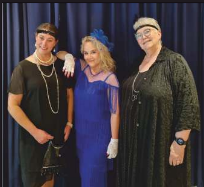
Houd jij ook van verkleden, zingen en toneelspelen? Word dan lid van onze club.

Als je ons laat weten wanneer je een repetitie zou willen bijwonen, dan zorgen wij ervoor dat er iemand aanwezig is om je te begeleiden en al je vragen te beantwoorden.